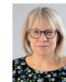
Krönikör: Elin Lindström

Då tänker jag att hon måste älska tvättstugan ännu mer än jag.