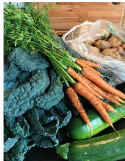
Lönen för mödan. Inget smakar så gott som grönsaker man hämtar i sin egen odling!

Text: Rebecca Hallqvist