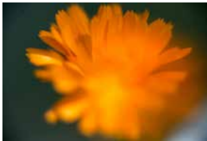
Ringblomma, Calendula officinalis

Försådder behöver extra ljus så här tidigt, även om de står i fönstret. Dagarna är ännu för korta, så komplettera med lampor så att de får ljus minst 8 timmar om dagen! Lamporna skall lysa nära över växterna, ungefär