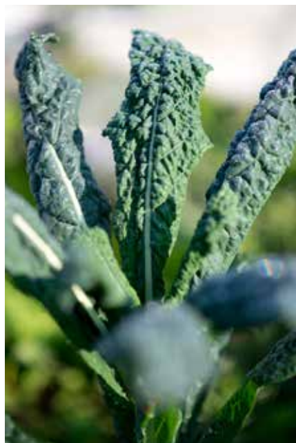
Svartkål eller palmkål, Brassica oleracea palmifolia

Kanske kommer det någon vinterknäpp till, men nog är det dags att börja planera för årets odling. Vissa växter kan sås redan nu, inomhus, för att de skall hinna bära frukt under den korta svenska sommaren.