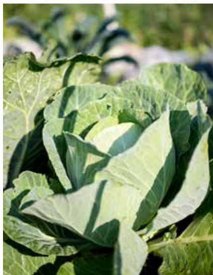
Vitkål, Brassica oleracea alba

Ringblommor och sömntutor kan också sås ute.