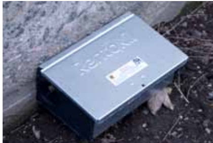
Rentokil ansvarar för rättbekämpningen i området.