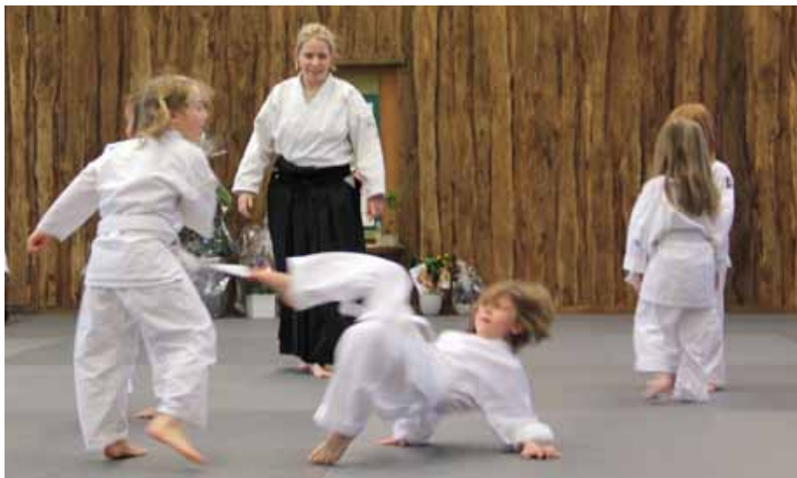
I början av april invigde aikidoklubben RiAi sina nya lokaler på Raketgatan. Här bedrivs aikidoträning för alla åldrar.