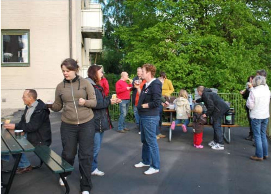
Fikapaus i utefixandet. Ett femtiotal grannar ställde upp och gjorde värfint i den gemensamma utemiljön under städdagen torsdag den 14 maj.