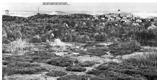
Den nordöstra delen av Norra Guldheden 1947. Bild från Antikvariskt planeringsunderlag. Göteborgs Stad, Stadsbyggnadskontoret, november 2008.

Nya gator måste alltså läggas ut och en trafikplan skapas i och med att området skulle exploateras. Arbetet med planen hade påbörjats i början av 1900-talet av dåvarande stadsingenjören Albert Lilienberg, känd för sina nationalromantiska stadsplane- och byggnadsidéer. Men nu var det andra tider. Funktionalismens modernism med fristående bostadshus i natur förespråkades av Uno Åhrén, som flyttat från Stockholm för att vara stads-