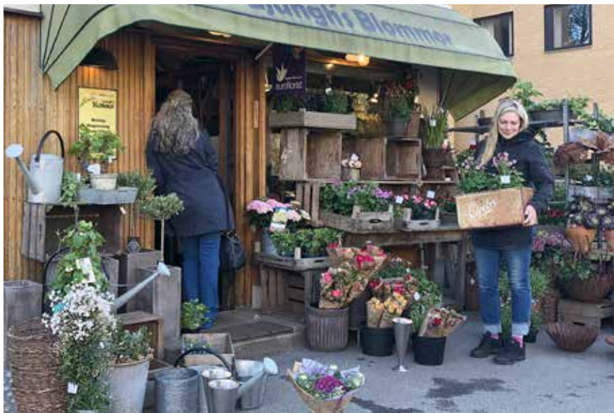
Maxantal kunder i butiken och förändrad försäljning för Ljunghs blommor i pandemins spår.