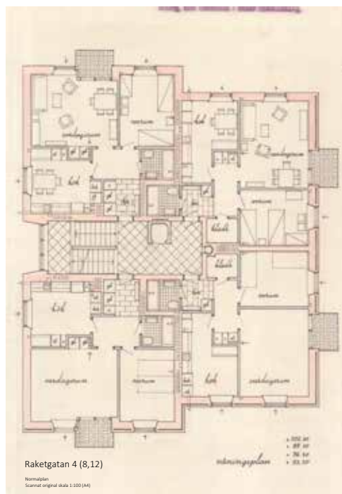
Raketgatan 4 (8,12)

Arbetet med servicetunneln för Västlänken i Medicinareberget har gått något långsammare än planerat, av orsaker som inte är relaterade till coronasmittan. Trafikverkets prognos är att arbetet går framåt med drygt 50 meter i månaden, och att servicetunneln når sitt mål vid Föreningsgatan i september eller oktober. Inom en eller två månader tros störningarna från arbetet i tunneln minska för boende i vår förening.