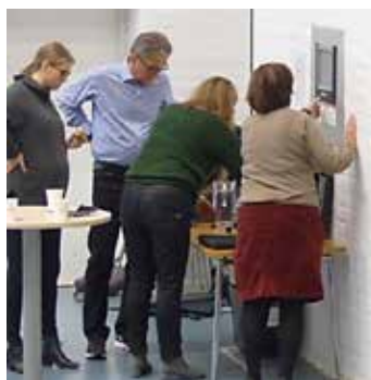
Teknikstrul löses av styrelsen.