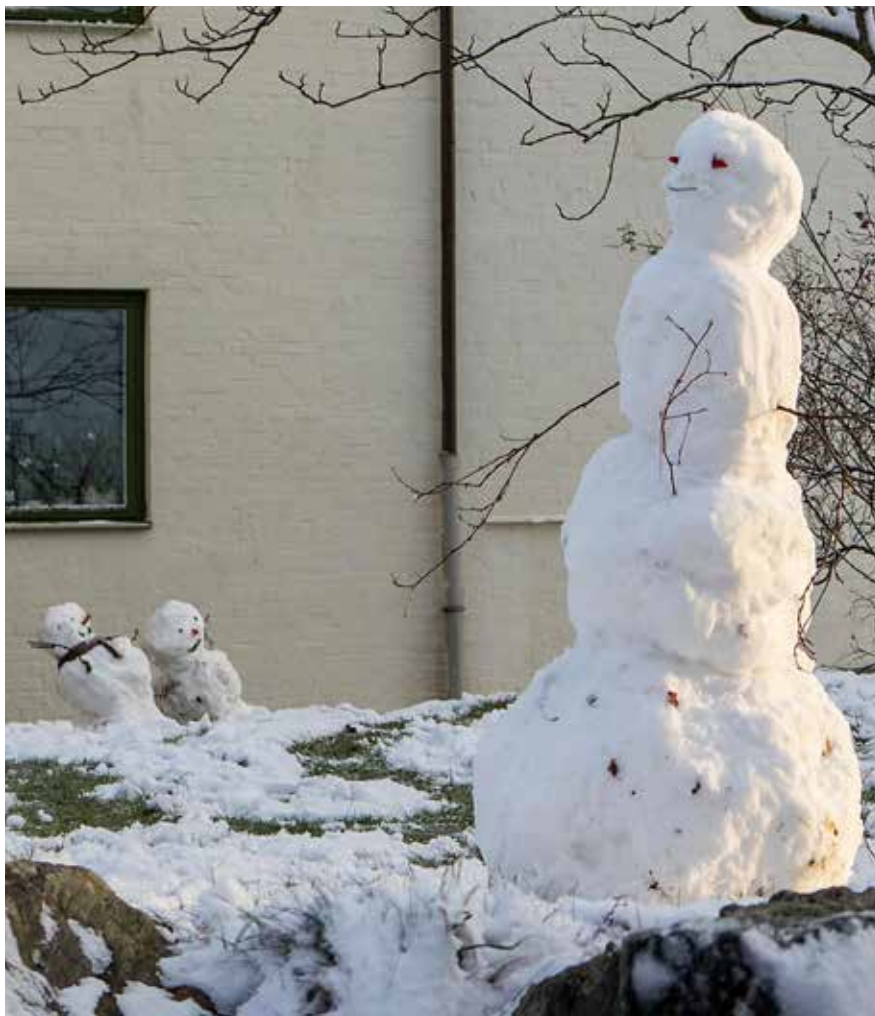
I november kom säsongens första snö och områdets snöskulptörer skred genast till verket.

Många medlemmar tog chansen att få information från styrelsen under mötet som hölls i Palmstedtsalen på Chalmers den 28 november.