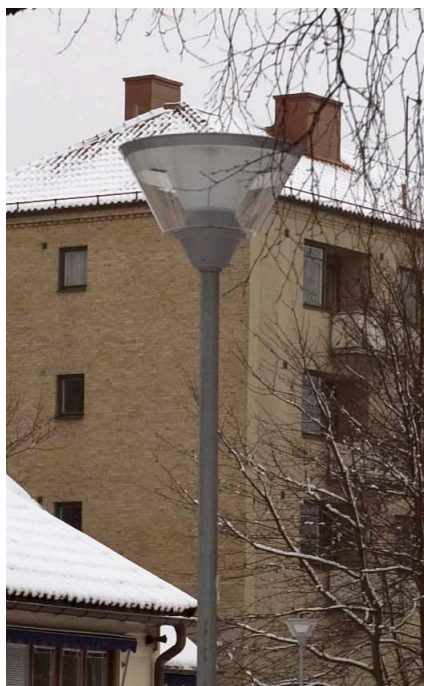
Dagisbarnen har fått ny utebelysning.