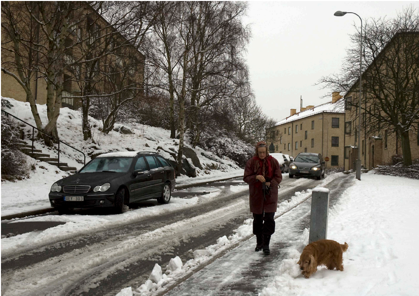
Den 12 mars tog vintern ett nytt grepp om Norra Guldheden. Är det sista snön för säsongen?