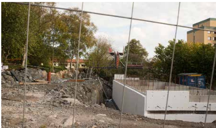
Bygget av studentbostäder på Guldhedstorget har avstannat. Marklov finns, dock inget bygglov.

Som vi alla har kunnat konstatera har bygget av studentbostäder nu påbörjats vid Olsson Trädgård. Ett stort hål i marken har grävts upp men därefter har inte så mycket hänt. Förklaringen ligger i en mellankommande semesterperiod men även att SGS Studentbostäder ännu inte fått bygglov. Marklov har beviljats men därefter har det varit stopp. Stadsbyggnadskontoret ställer mycket höga krav på den arkitektoniska utformningen av byggnaden och kommunikationen och beredningen har tagit sin rundliga tid.