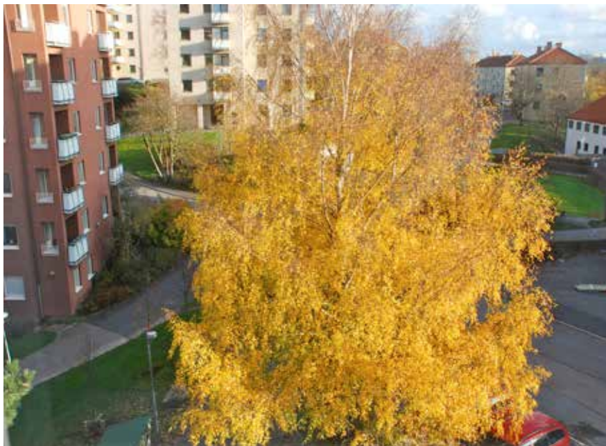
Raketgatan i höstskrud.