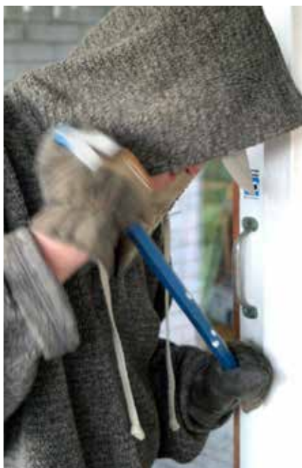
Föreningen har haft påhälsning av inbrottstjuvar ett flertal gånger på senare tid.