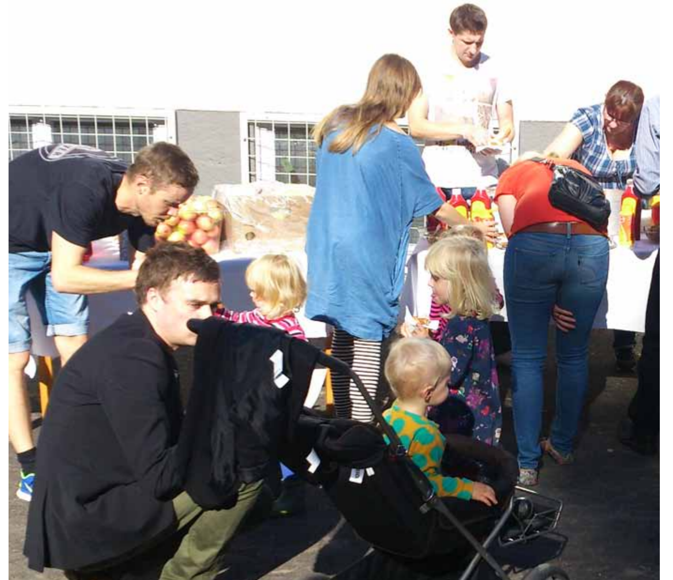
Föräldrar, barn och personal vid nyrenoverade förskolan Daniel Petterssons gata firar nyinvigningen med korv och bröd.

INFORMATIONSBLADET FÖR BOENDE I BOSTADSRÄTTSFÖRENINGEN NORRA GULDHEDEN NR 1 NR 3 NOVEMBER 2013