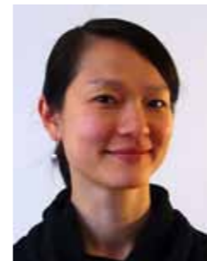
Po Ts'an Goh

– Det är med sin geografi, där det ligger högst uppe på ett berg, en oas trots att det är så stort. Och det har kvar 1950-talskaraktären. Just det, gör det till en utmaning att bevara, utveckla och förvalta.