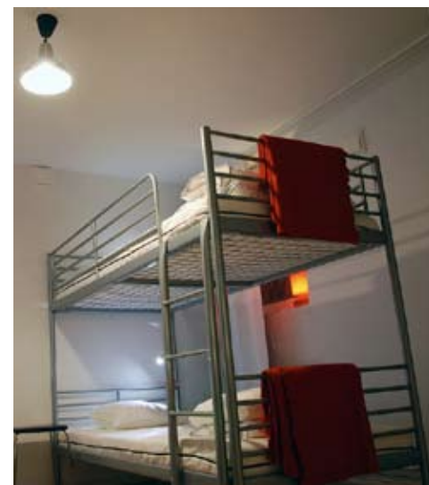
En av lägenhetens två våningssängar.

Golven är genomgående av ekparkett och badrummet är helkaklat. Väggar och tak har målats vita i samtliga rum. Köket är enkelt men helt nytt. Här finns kyl, frys, vattenkokare, enklare servis, husgeråd och bord