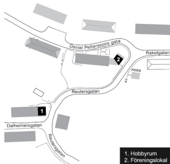
1. Hobbyrum 2. Föreningslokal

Ska du måla köksstolar? Eller bygga en hylla? Alla boende i området kan utnyttja vår hobbylokal på gaveln Dalheimersgatan 1 i garaget längst till höger. Villkor och kontrakt finns på föreningens hemsida och hos fastighetsskötarna där också nyckeln kan kvitteras ut. Just nu finns bänk med skruvstäd, rinnande vat-